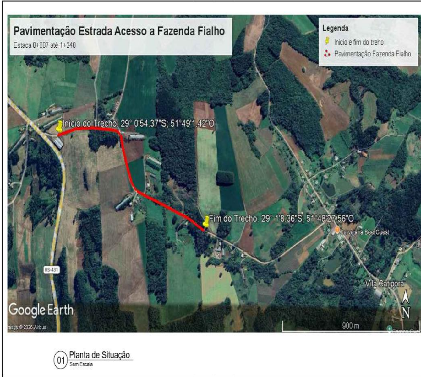
01 Planta de Situação Sem Escala

Documento assinado digitalmente gov.br LUIZ HENRIQUE DIAS CORRÊA Data: 2026.05.28 17:18:59-0300 Verifique em https://verifica.br.gov.br