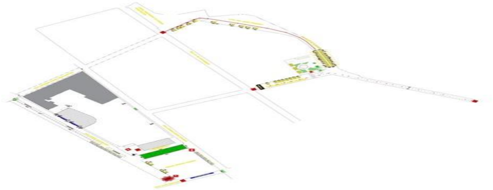
ANEXO I Croqui da 38ª Festa Feira Agrícola e Artesanal de Morretes)

Publicado por: Deborah Charello Dos Santos Código Identificador: 68C27B14